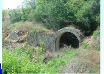
Πέτρινο γεφύρι στην περιοχή Σαχίνι Νικηφόρου

Μηνιαία πανδραμινή πολιτιστική & κοινωνική εφημερίδα